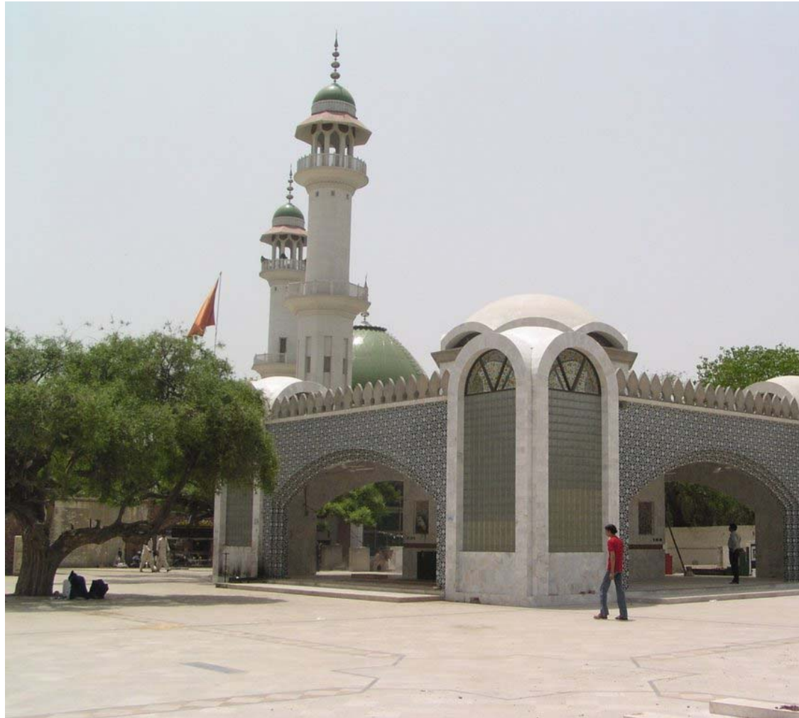
ਕਸੂਰ ਵਿਚ ਸੂਫੀ ਸ਼ਾਇਰ ਬਾਬਾ ਬੁਲ੍ਹੇ ਸ਼ਾਹ ਦਾ ਮਜ਼ਾਰ